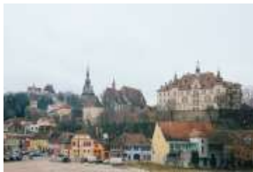
Lokalsamfundet (længere sigt)