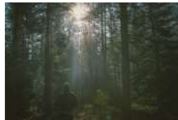
Miljø/naturen (lang sigt)