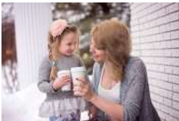
Kunderne (kort sigt)