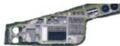
Arhus water Ltd, +150 %