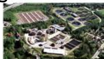
VCS denmark, Odense + 154 %

The Energy Producing WWTP – it can be done